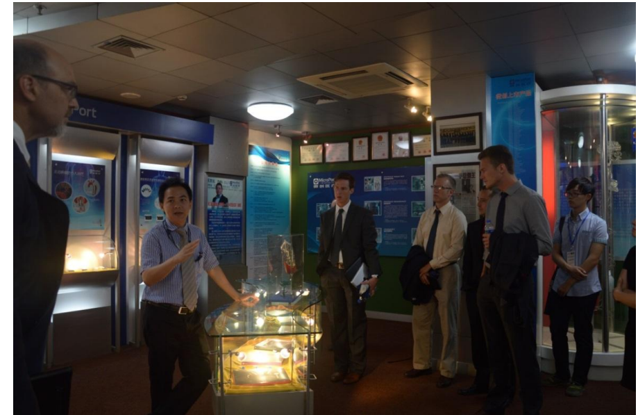
微创医疗的媒体宣传主管西村先生向学员们解说了其最新产品

微创作为国内发展迅速的医疗器械模范企业，其商业发展模式以及在医疗器械领域的所取得成就是值得学习的。