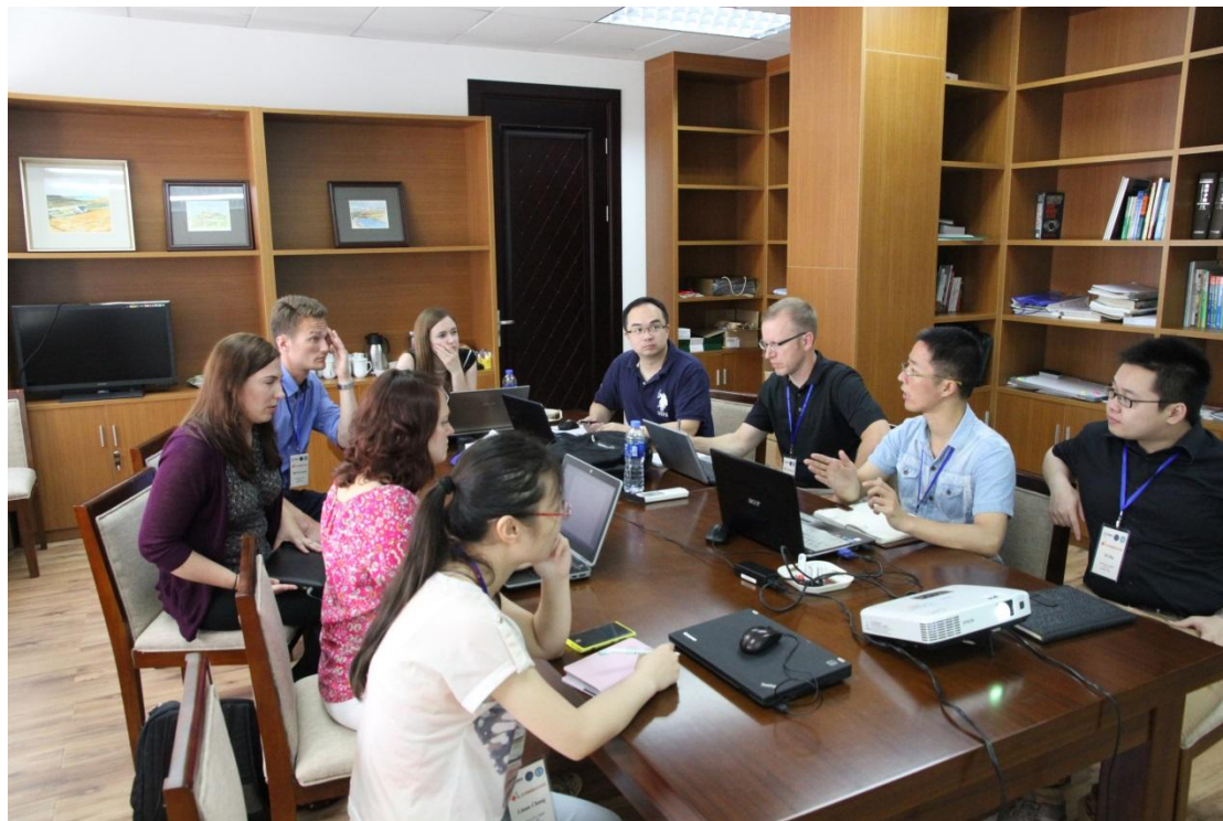
头脑风暴 - 中美学员热烈讨论医疗器械产业的机遇

中方学员大多是上海理工大学医疗器械与食品学院的博士生和研究生，对于产品技术有很好的了解。而美方学员多数在医疗器械行业市场方面有着多年的经验。大家各司其职，分别从知识产权专利、产品现有市场份额、资金链等、政策法规、技术评估等方面对项目进行分析。中美两方互相交流学习，最终的答辩展示也是两方通力合作的成果。