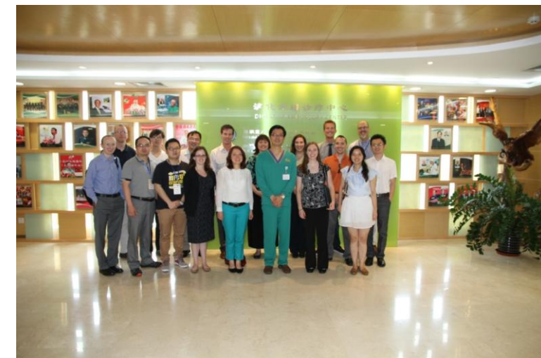
长海医院-消化内镜治疗中心

第二军医大学附属长海医院、中国人民解放军第二军医大学一附院，作为一所集医疗、教学、科研为一体的现代化大型综合性医院是一所三级甲等医院。